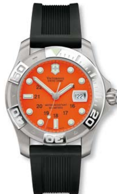
DIVE MASTER 500