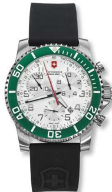
MAVERICK II CHRONO