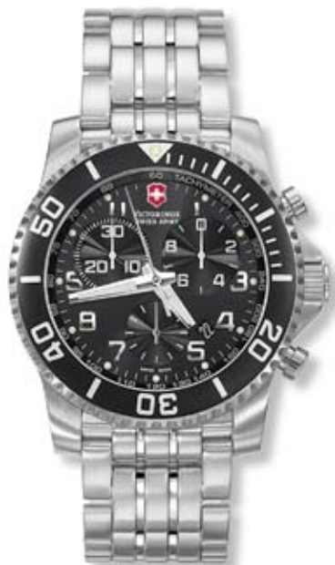
MAVERICK II CHRONO