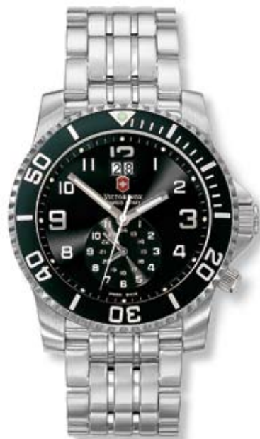
MAVERICK II DUAL TIME