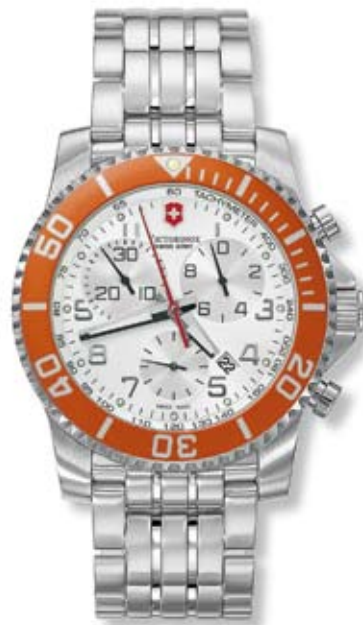
MAVERICK II CHRONO