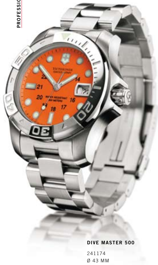
DIVE MASTER 500