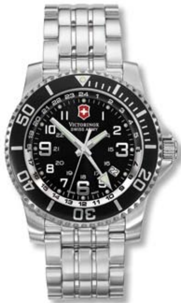
MAVERICK II 2 ND TIME ZONE