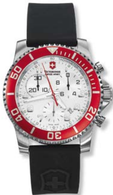
MAVERICK II CHRONO