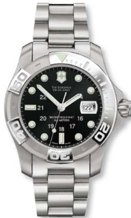
DIVE MASTER 500

Movimento svizzero al quarzo Cassa in acciaio inossidabile (316L) Vetro zaffiro antiriflesso Impermeabile fino a 500 m (50 ATM, 1650 FT) Fondo a vite Corona avvitata Lancette e indici luminescenti Lente di ingrandimento per la data integrata nel quadrante Ora militare Proteggi-corona Lunetta girevole unidirezionale con 120 denti Indicatore esaurimento della batteria