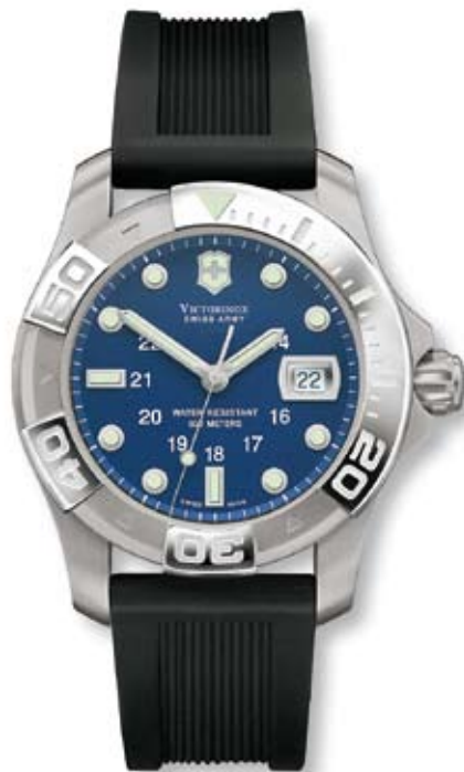
DIVE MASTER 500