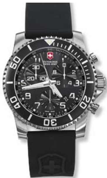
MAVERICK II CHRONO