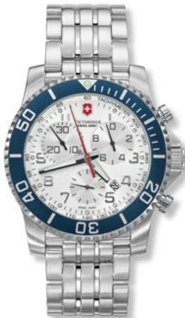
MAVERICK II CHRONO