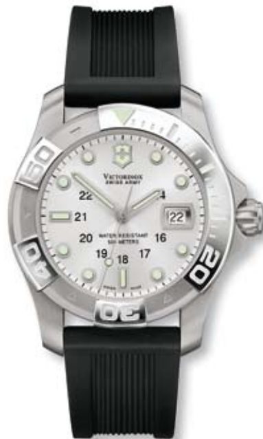
DIVE MASTER 500